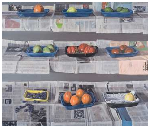
LA ABUNDANCIA, 2017