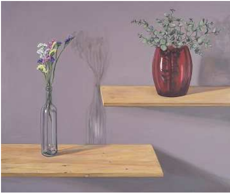
SIEMPRE VIVAS, 2018

“Vinculado desde muy joven a la creación plástica tanto en pintura como en fotografía, resulta significativo que esta sea su primera exposición en treinta años, y pone de relieve que mostrar su trabajo no ha estado entre sus prioridades” señala el comisario.